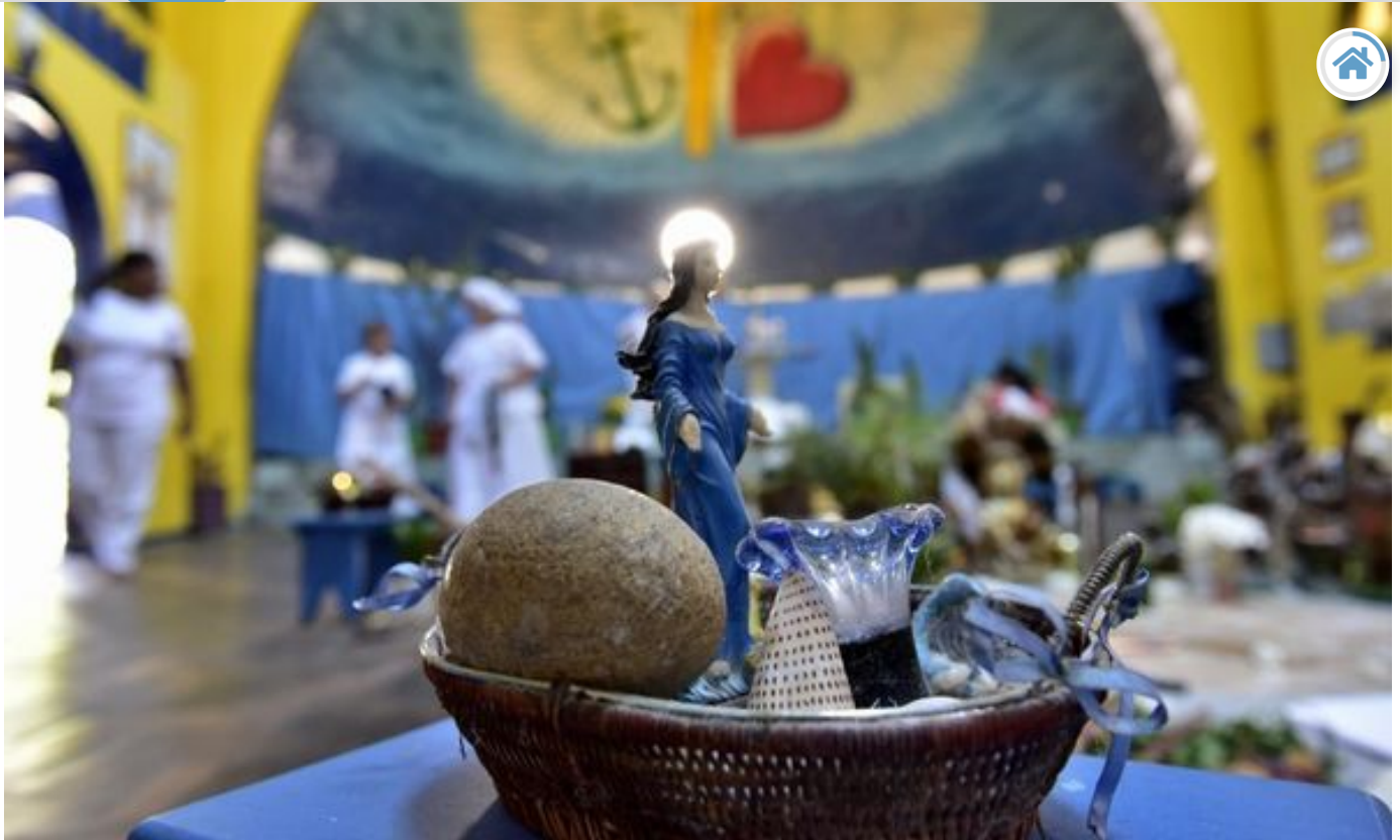
Cerimônia na Fraternidade Tabajara.