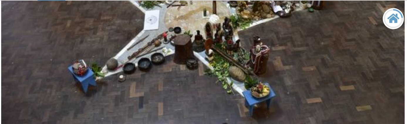
Cerimônia na Fraternidade Tabajara.